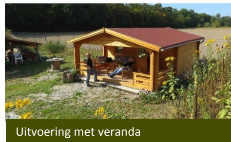
Uitvoering met veranda